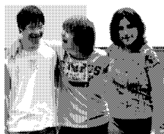
I ragazzi del progetto Nemo insieme agli operatori dell'Ausl e del Circolo subacqueo

Il progetto Nemo, per il quale il circolo subacqueo ha prestato una collaborazione totalmente gratuita, potrà continuare grazie al contributo del Lions Club Bisanzio, che ha donato 1.500 euro, integrando altri bambini con disabili.