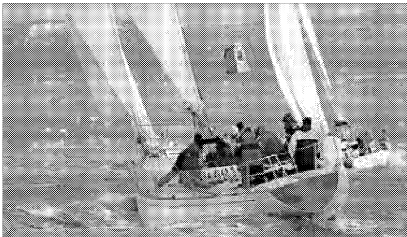
Al circolo nautico di Cervia "Amici della Vela" parte oggi il primo appuntamento con "Il mare che cura"

CERVIA - "Il mare che cura": è questo il progetto che nasce da esperienze di progetti di velaterapia già attivi nel territorio di Ravenna ed ha l'obiettivo di facilitare l'accesso al mare ai giovani ed agli adulti diversamente abili e con disagio relazionale, attraverso laboratori di barca a vela. A Cervia il progetto ha salpato a maggio e sta continuando la navigazione mantenendo una buona rotta con gli equipaggi della cooperativa sociale Lo Stelo e l'associazione Impronte di Solidarietà. Oltre al laboratorio aperto per gli adulti questa mattina (ore